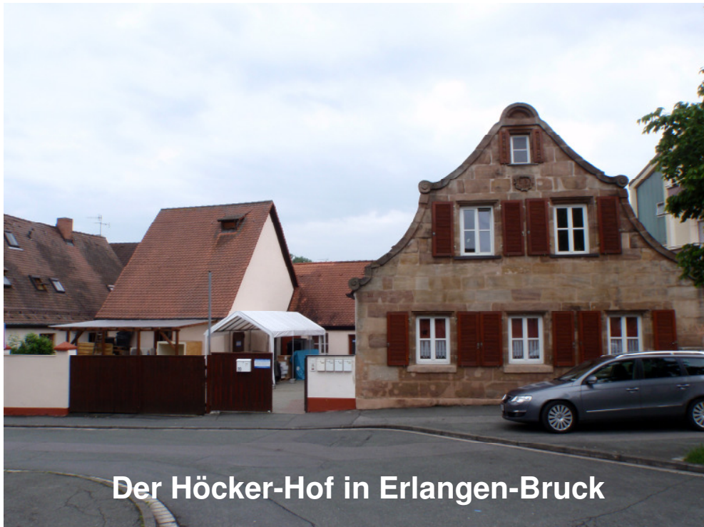
Der Höcker-Hof in Erlangen-Bruck

Historisches Gebäude um 1740, Denkmalschutz Sandstein und Fachwerk, 250 m 2 beheizt mit cop-star-Wärmepumpe und normalen Heizkörpern! Besichtigung möglich, Anmeldung: 09131-685268